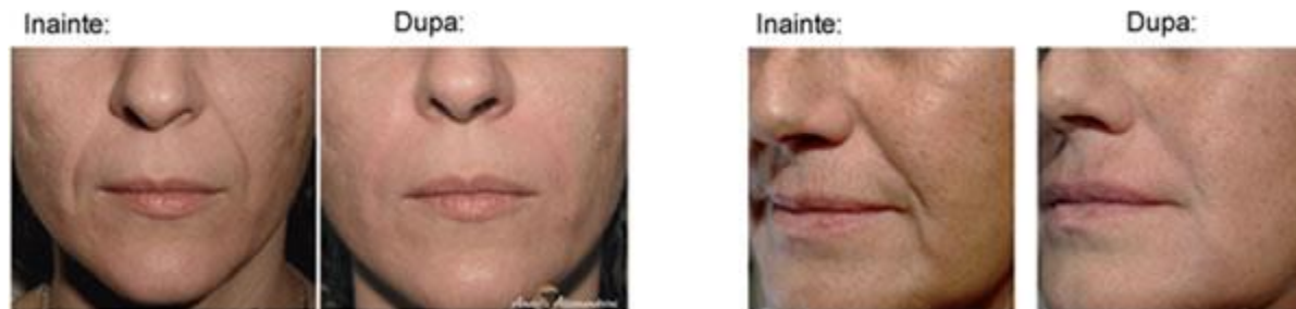
Corectia nechirurgicala a buzelor- filler cu acid hialuronic INAINTÉ DUPA TRATAMENT