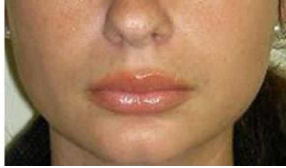
INAINTE / DUPA TRATAMENT