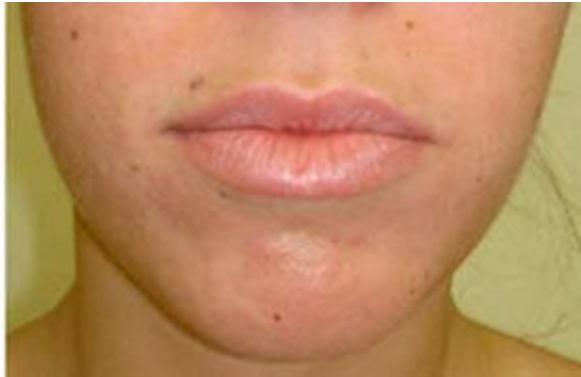
CORECTIA PLIURILOR NAZOGENIENE - FILLER CU ACID HIALURONIC INAINTE / DUPA TRATAMENT