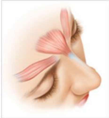
Figure 1: Relaxed glabellum muscles