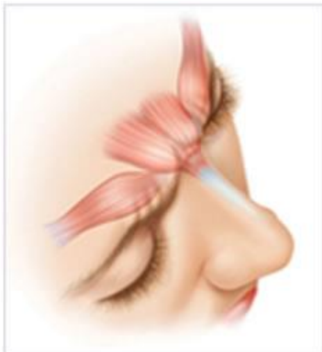
Figure 2: Contracted glabellum muscles

BOTOX® Cosmetic acționează blocând impulsurile nervoase către mușchii injectați. Aceasta reduce activitatea musculară ce cauzează formarea liniilor persistente dintre sprâncene.